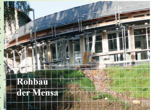
Rohbau der Mensa