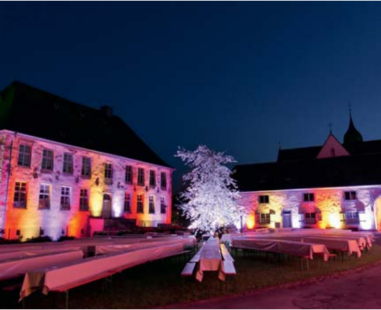
Haus Hemer während der 950-Jahr-Feier

Zur Gewerbe- und Wohnflächenansiedlung gehören allerdings auch eine schnelle Internetverbindung und eine gute Anbindung an das übergeordnete Straßennetz.